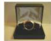
Regalos de Nivel