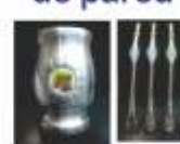
Mates y Bombillas