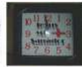
Relojes de pared